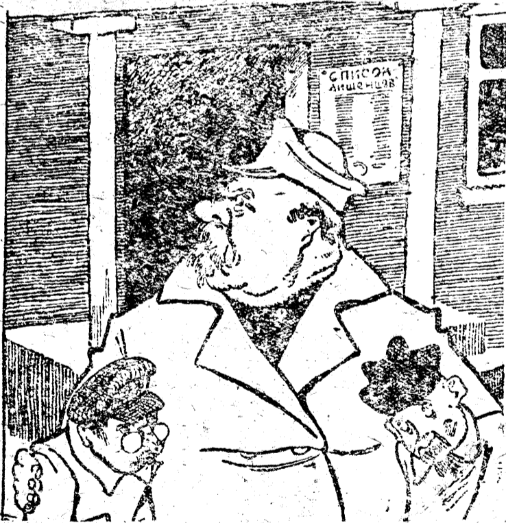
Очистить колхозы от кулаков и подкулачников

июльское задание выполнил на 200 проц, наполнив полугодовой прорыв. Колхозники заявили: „В рыбозаготовках ударных темпов не сдадим.“ Осипов.