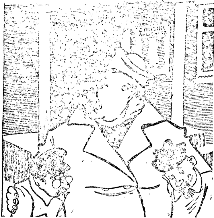
Вон чужаков из совета.