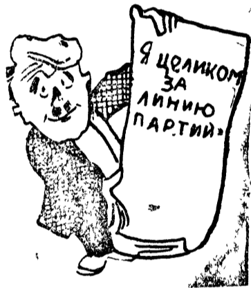
Мало сказать: „я за генеральную линию партии“—надо это доказать на деле.

Культпропы райкомов должны немедленно организовать проверку по ячейкам, обеспечить перелом в работе в ближайшие дни, развернуть партпросветительные полными ходом.