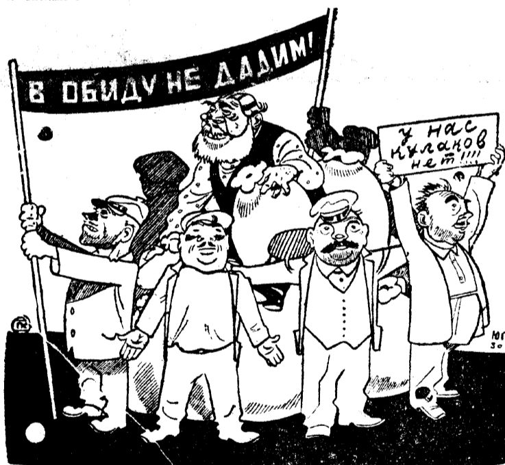
Реполовские, Нялинские и Зенковские нулаки под покровительством местных оппортунистов

Очистить колхоз от чужаков ударить по примиренчеству и кулацкой своре.