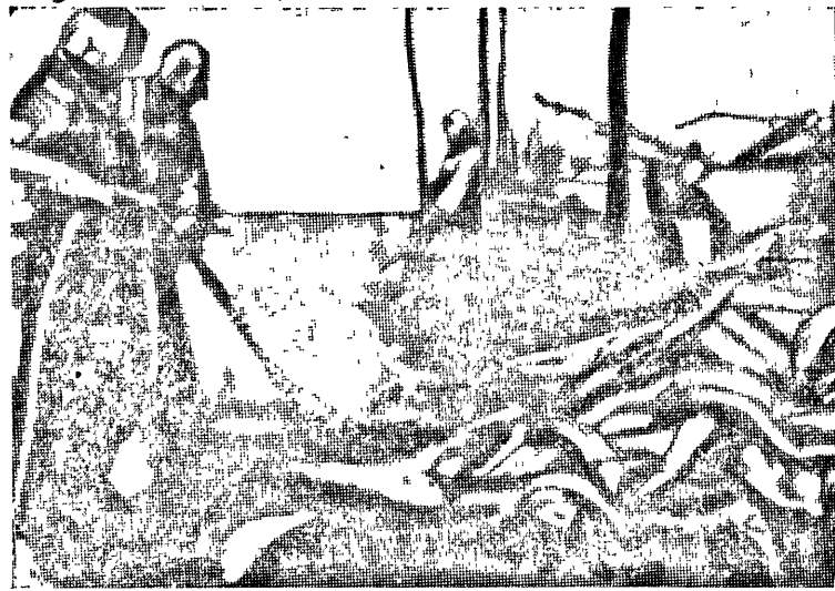
Ударными бригадами и круглосуточным ловом—ликвидировать прорыв на рыбпесках.

Для обеспечения бесперебойной работой консервного комбината, Уралрыбтрестом еще в апреле этого года был заключен договор с Окружным союзом интегральных товариществ на поставку по Самаровскому району в течении мая—августа 6500 тонн свежей рыбы. В дополнение к этому договору дирек-