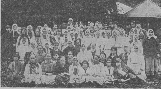
Сэрнур кантоныш марий ўдрамаш погынмаш.

Иўнның 4-шэ кэчэш Марий-обласын Сэрнур кантонышто пёрвой кана ўдрамаш погынмаш лийэ.