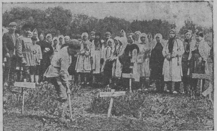
Совхозышто ўдрамаш-влак вож-саска шындаш тунэмы.

Йўштэ тэлэ эрта, чэвэр кэңэж толэш. Пўртўс ылыжэш, чыла чонан илаш тўналэш. Кэңэж чэвэр кэчи марий ўдрамаш дэкат шуун. Ожно ўдрамаш тэлыжэ, кэңэжшэ суртшо гыч ойырлымаш укэ ильэ, ваш лийыт гынат, сурт кокла илышым, моло тўрлэ оккўл мўтым вэлэ кутырат ильэ. Ындэ рэволўтсий лиймэ дэч вара ўдрамаш, шкэ йўлажым палэн налмбнгтэ, тарванаш тўналын. Шэңгэлан кодмыжым шинча, уло вийжэ дэн ончы кайнэжэ. Илышын сайжым, осалжым палэн налын, шкэ илышыжым тёрлатынэжэ. Шэрнур кан тон, Нурбэл районышто тўрлыжым кутыраш ўдрамаш-влак погынмашым штат. Тушто нунылан у илыш штымаш нэргэн каласкалэн пуат. 19 иўнылан Шэрнурэш погынмаш лийэ. Тудо погынмашкэ ўдыр-влак, рвэзэ, илалшэ ватэ-влакат погынэн улыт ильэ, чылажэ кумло йэн. Тушто пакча кёргё ончымо дэн чакотко нэргэн ольэн пуыч. Пакча ончымаш нэргэн ойлаш Соловьев йолташ мийэн ильэ. Тудо пёртыштэ ыш ойло, ўдрамаш-влакым совхоз пакчаш нантайыш. Тўналтышлан садэш шындымэ, ончымо нэргэн ончыктылы, каласкалыш. Вара парник нэргэн умландарэн кутырыш. Умбажыжэ, йыранг ўмбаж кузэ шындаш, кузэ сайын ончаш кўлэш, вуйгэ ончыктылын кутырыш. Пытаргышлан пасушкат намийэн конгышто. Ончэн коштмо годым адак шуко йэнг ушнышл.