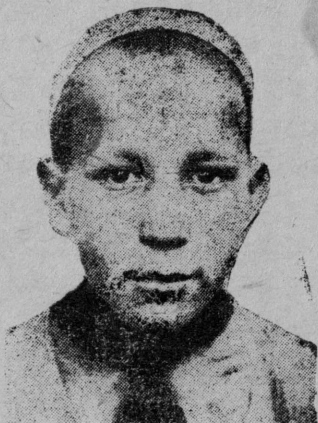
Шэрстньов—ударник (Йошкар-Ола, ФЗС).

Шып. Чыланат сайын пылыш шогалтэн, иктэ-вэсылан мэшайыдэ колыштыт.