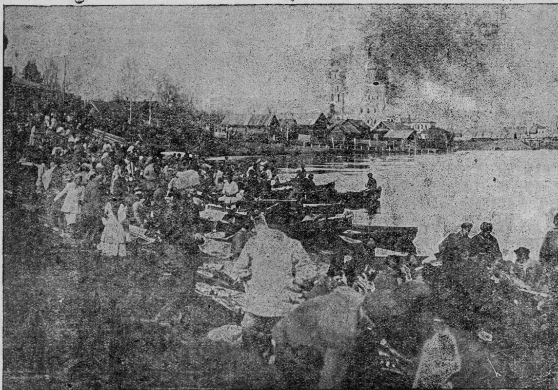
Иошкар-Олаштэ орус волтышо-влакым ужатат.

— Ит ойгыро, кузэ гынат пашатым рончэн рончэн мучашыжым муына. Тылэч варажым ушэт лийжэ!—Ала мо кыдэжыштэ возэн шуктышо Ма-рльа Микитан вачыжым вўчкалтэн пэлэшта.