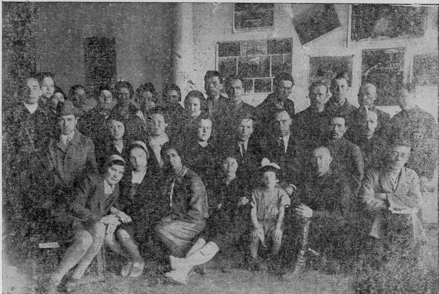
Озагыштэ ВПИ-штэ тунэмшэ студент-влак.

Куго вэрым Трактыр дэнэ лэктына—куралаш! Машинажым Кичкэна, Шурным Ёдалаш! Мурынажэ у сэм дэнэ Йонгыжалтшэ кумдыкэш! Куатнажэ чот вийанжэ, Помыжалтшэ шэм нурэш! Трактыр Мўгырө, Калыкым пого, Рўжгыжө Кэтэк 7) урэмэт! Эй! Трактыр дэнэ Кудалаш Пуза Корным Качийлан!.. Н. Тишин.