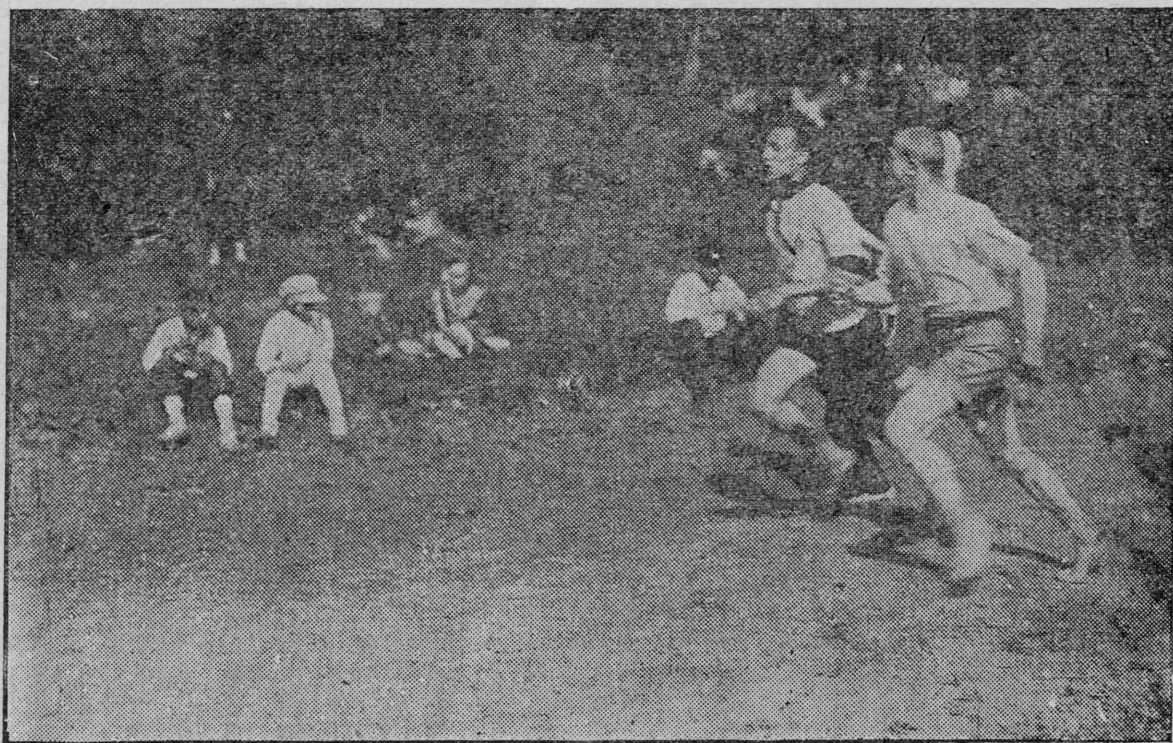
Йошкар Пэлэдыш пайрэм—Нартасыштэ.

Октэбр рэволютсий дэч вара илышна у корныш лупшалтын. Мо ок кэлшэ, тоштэмын, йорды-