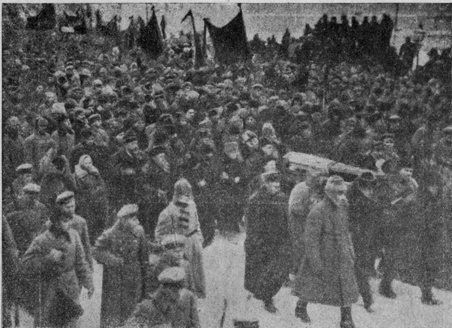
Лениным тойаш нынгайат.

Сотсиализм илыш, йошкар тул уло тунья үмбаке пэнгыдын шарла. Тунья пашазэ, йорло