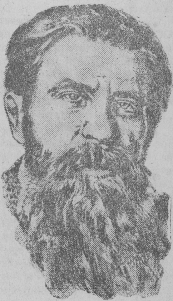
Тов. О. Ю. ШМИДТ, бывший начальник экспедиции на „Челюскине“, сейчас управляющий Главсевероморпути.

Арктический институт Шмидту, Самойловичу