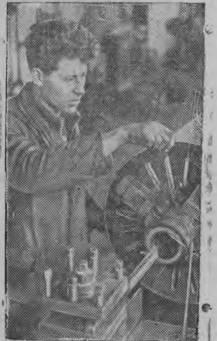
Ремонт тракторов в молочно-животноводческом совхозе «Котлубань» № 75 (Городищенский район, Сталинградская область).