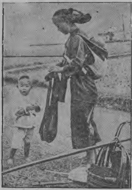
НА СНИМКЕ: Китайская крестьянка из окрестностей Кантона.

Одновременно «Иллюстрированы курьер Подзенны» сообщает, что эпизоотия ящура сильно распространена в германской Силезии. В ряде местностей германской Силезии в связи с эпизоотией еще раз отменены ярмарки. По сообщению газеты «Нова правда», от эпизоотии ящура в Германии уже погибло полтора миллиона голов скота.