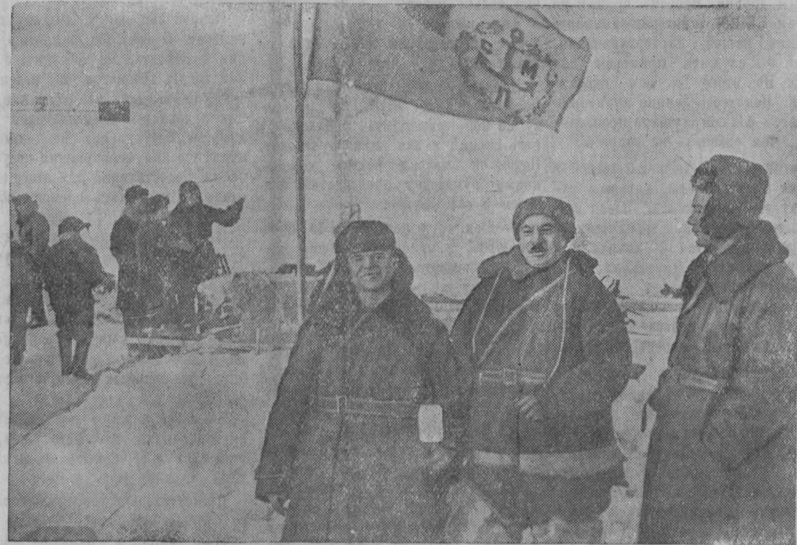
19 февраля в 17 ч. 30 м. дрейфующая станция «Северный полюс» закончила свою работу. Героическая четверка папанинцев была снята с дрейфующей льдины в Гренландском море славными экипажами ледоколов «Таймыр» и «Мурман».