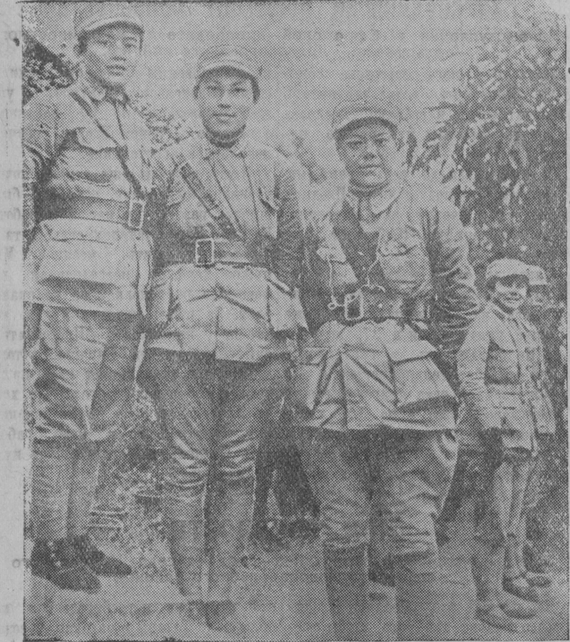
НА СНИМКЕ: девушки—офицеры китайской армии, пришедшие на фронт из учебных заведений.