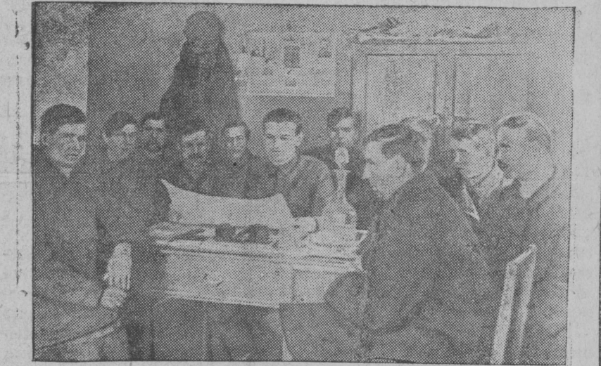
На днях в Рамешковском сельсовете состоялось производственное совещание председателей колхозов и бригадиров. Был обсужден вопрос о готовности к весеннему севу и развертыванию социалистического соревнования во время полевой кампании. Колхозы заключили друг с другом социалистические договоры. НА СНИМКЕ: момент совещания.

Для удобства пропагандистской работы все колхозы разбиты на десятидворки.