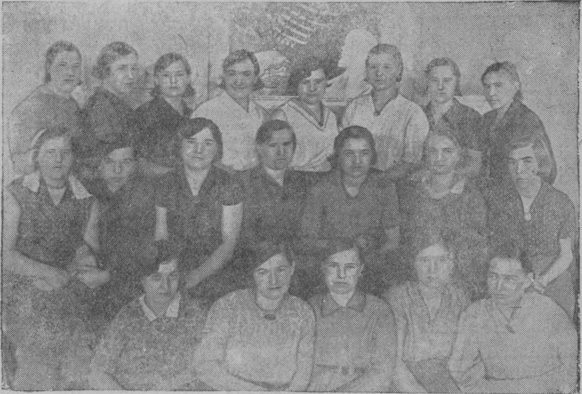
НА СНИМКЕ: сквозная стахановская бригада Рамешковской трикотажной артели. Производственную программу за 1937 год она выполнила на 127 процентов. За январь и февраль 1938 года бригада выполнила производственный план на 145 процентов.