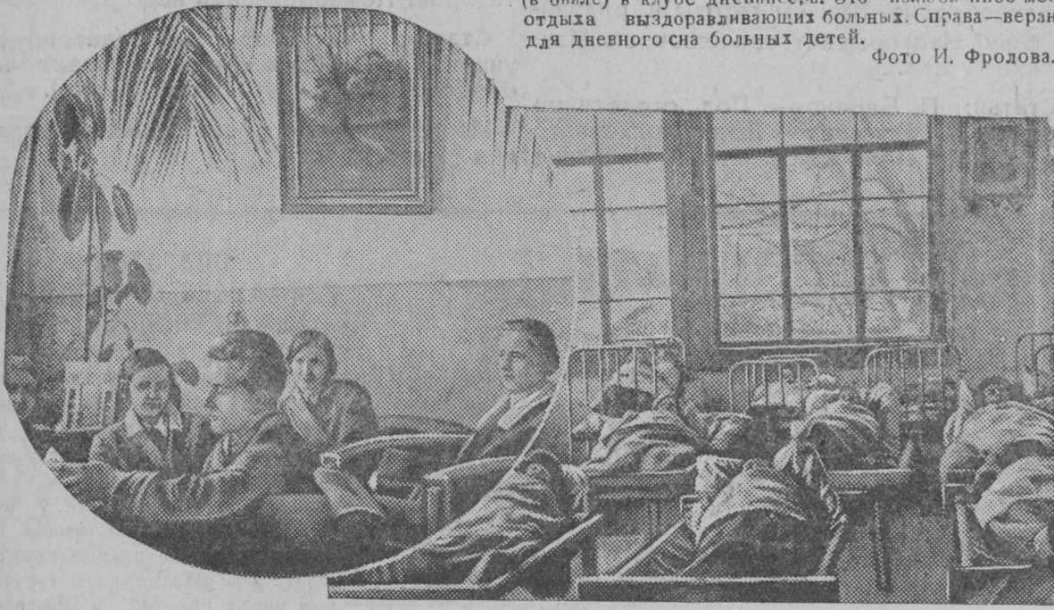
В Калининском туберкулезном диспансере. Слева (в овале) в клубе диспансера. Это — излюбленное место отдыха выздоравливающих больных. Справа — веранда для дневного сна больных детей.