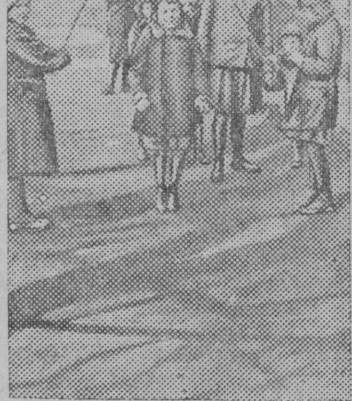
В СОЛНЕЧНЫЙ ДЕНЬ. Набережная р. Тьмаки. гор. Калинин.

О перевыполнении квартального плана сообщают также предприятия кондитерской, хлебной, чайной, мясной, рыбной и других отраслей пищевой промышленности. (ТАСС).