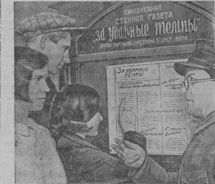
1-го апреля вышел тысячный номер стенгазеты «За ударные темы» третьей дистанции пути Октябрьской ж. д. НА СНИМКЕ: железнодорожники читают свежий номер своей любимой стенгазеты.

На этой почве возникло и развивается стремление вместо усовершенствования педагогического мастерства, упорной и настойчивой борьбы за постоянное повышение уровня знаний учащихся, — идти по линии наименьшего сопротивления, а именно: всяческими путями отделиться от учеников, неудовлетворяющих педологической стандартизации. Применительно к этому разработана была и «методика» педологических обследований. Эти, якобы, научные «обследования», проводимые среди большого количества учащихся и их родителей, направленные, по преимуществу, против неуспевающих или неукладывающихся в рамки школьного режима школьников и имели своей целью доказать якобы с «научной» «биосоциальной» точки зрения современной педологии наследственную и социальную обусловленность неуспеваемости ученика или отдельных дефектов его поведения, найти максимум отрицательных влияний и педологических извращений самого школьника, его семьи, родных, предков, общественной среды и тем самым найти повод для удаления школьников из нормального школьного кол-