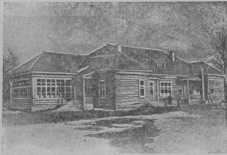
Муллозен вуввен лопулла Лихославляшша авуачеттх уввет ласин яслит. Хуё облуживайх линнан Лихославлян трудящойлоин 65 ластва. 2-ста кубства колхоз вудех суат. СММКАЛЛА: Внешней ласин яслилйин вйду.