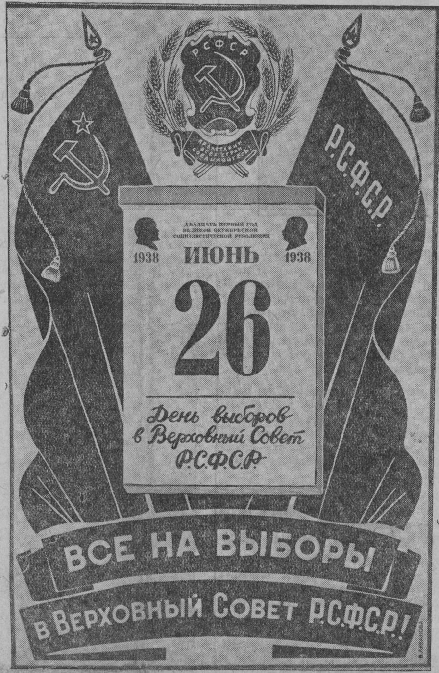
На сн. Плакат работы художницы В. Ливановой, выпущенный Изогизом к выборам в Верховный Совет РСФСР.