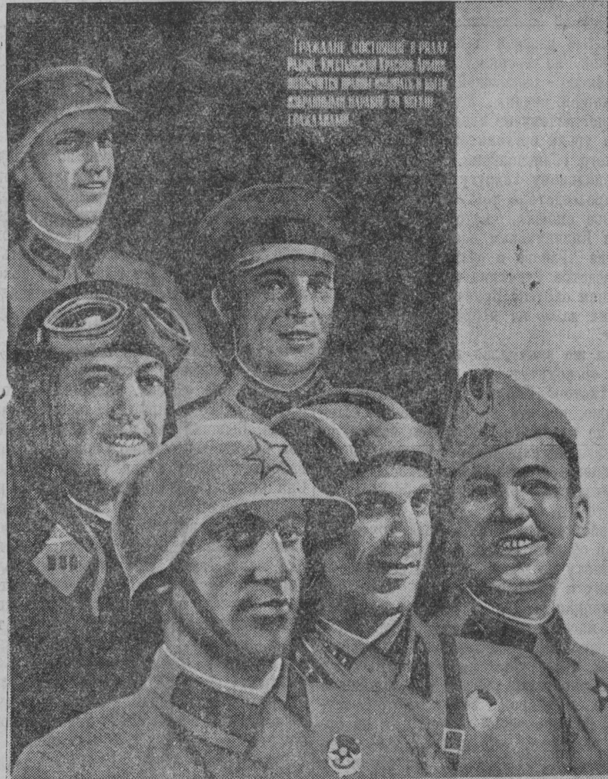
В Верховные Советы Союзных Республик Рабоче-Крестьянская Красная Армия пошлет лучших своих представителей беззаветно преданных делу коммунизма, делу Ленина—Сталина

На снимке: плакат работы художника Сурьянинова, изданный Военгизом к выборам в Верховные Советы союзных республик.