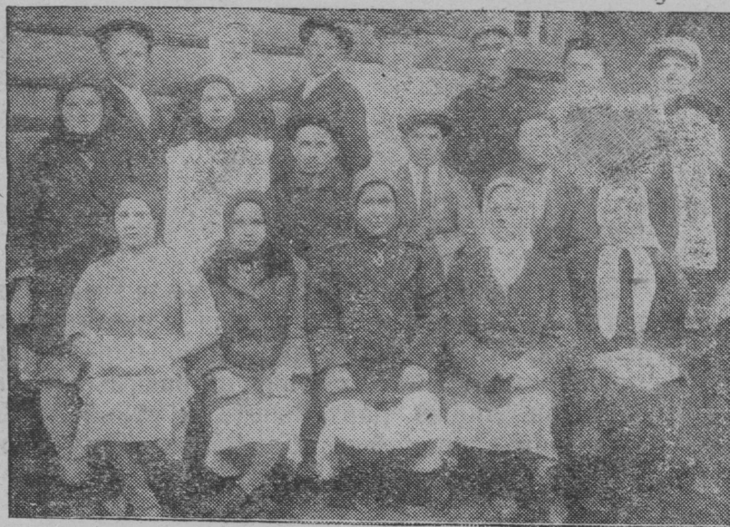
Иошкар-Ола район Арбан с.-сов. кӧргысӧ колхозник, колхозницэ- влак колхоз пасушто пӑрвый полышым пуаш тунэмыт.