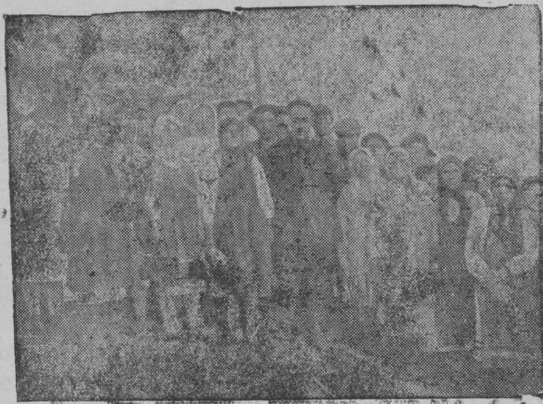
ВКП(б) Обком сӕкрӕтар ШИРВАНИ йолташ Провой район ударник-колхозник сльотыш мийшэ ўдрамаш дэлэгат-влак коклаштэ.

Сомлымо паша, урымаш, мландэ пушкыдэмдымаш, шурно погэн налмаш утларакшэ ўдрамаш вий дэн ышталтэш. Тидэ паша дэн, нигунам дэч коч ўдрамаш-влак Сталин йол. „Колхозышто ўдрамаш кугу вий, нуно шэнгэлан кодшо гыч пэш ончык кайэн улыт“ манмэ мутшым ышкэ пашашт дэн ончыктат.