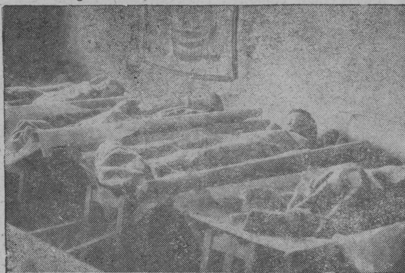
Иошкар-Ола йаслыштэ йоча каныш.