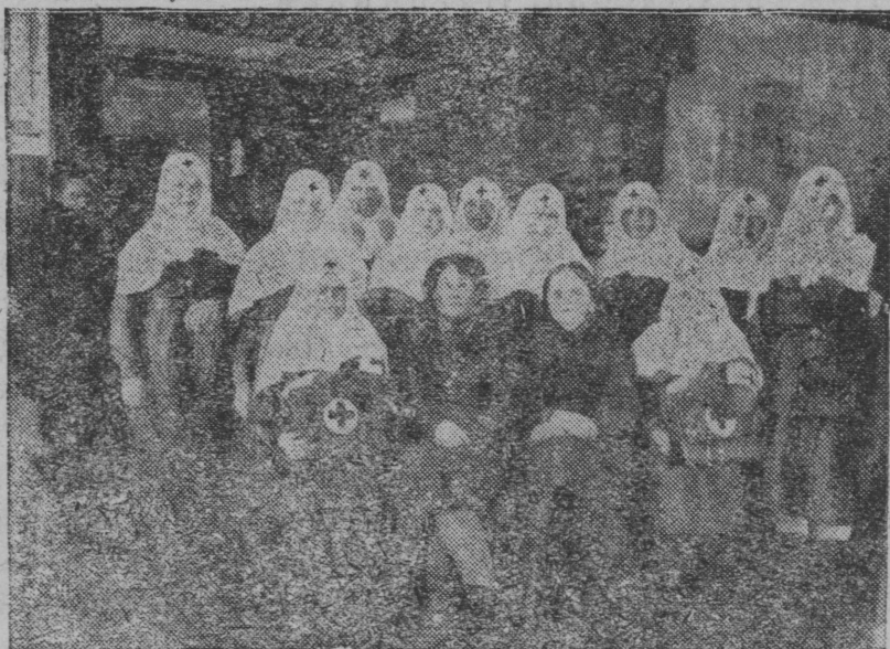
Иошкар Ола Мэдтэхникум пэлэн РОКК кружокышто тунэмшэ ўдыр-влак.