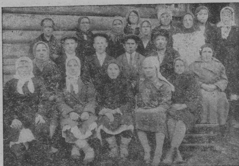
Нурма врачэбный пункт пэлэн йаслыштэ йоча ончышо-влакым йамдылымэ курс организоваймэ.