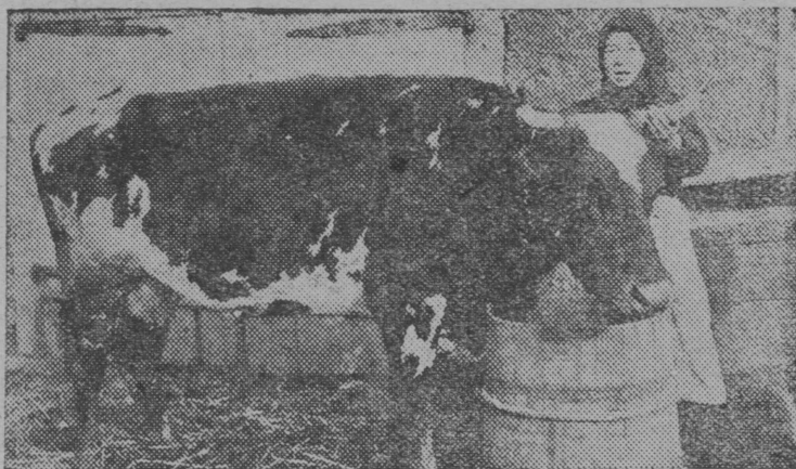
„Волгыдо“ комун МТФ-ын (М. Турэк р-н) ушкалжэ кэчэш 30 литр шөрым пуа.

Кулак, тудын түрльө полшышыжо вольык шукэмдышашым чараклашлан эрэ чаракым шындаш төчат. Түрльө осал пашам ыштылын: фэрмыштэ шогышо прэзэ-влаклан шўшө шудым, йандаум, пудам монь кышкат, тыгэ иктэшлымэ прэзым пыта-