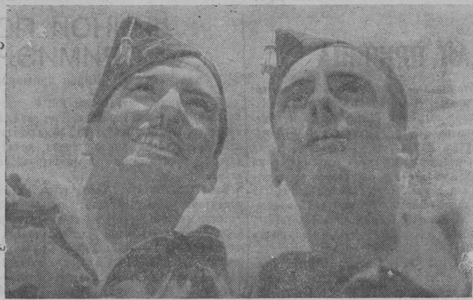
В Республиканской Испании. НА СНИМКЕ: Молодые летчики следят за полетом республиканских самолетов.

В совхозе «Кубань», Ванновского района, Краснодарского края, открыт памятник В. И. Ленину. Памятник установлен в совхозном парке. (ТАСС).