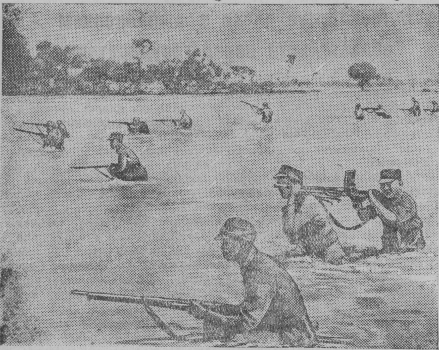
НА СНИМКЕ: Бойцы народно-революционной армии Китая переходят брод места, залитые рекой Луен-хэ.