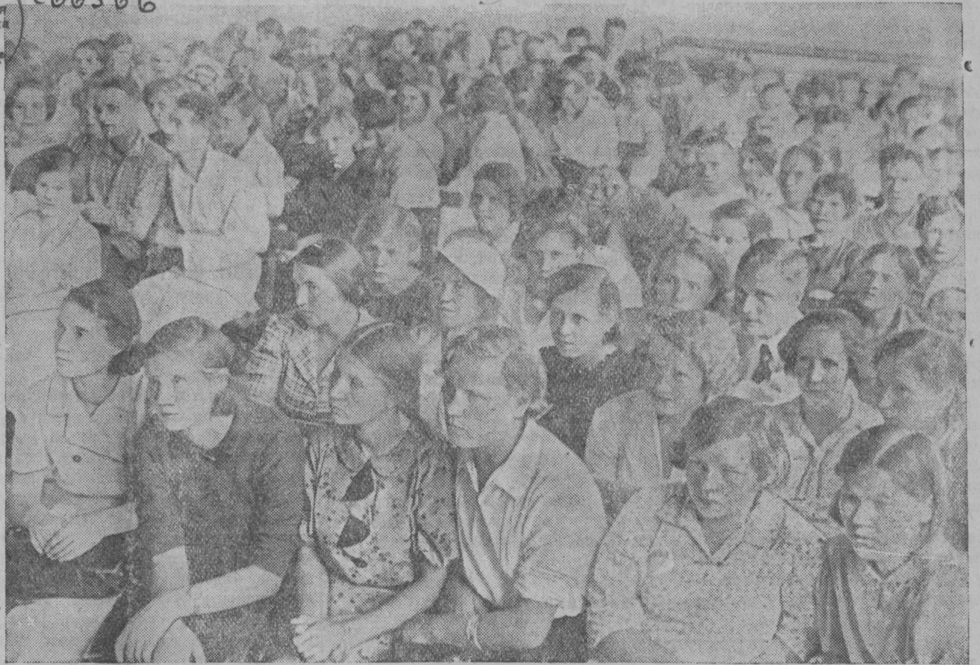
НА СНИМКЕ: Общий вид зала заседания районного учительского совещания в г. Лихославле.

Международная и внутренняя информация (4 стр.).