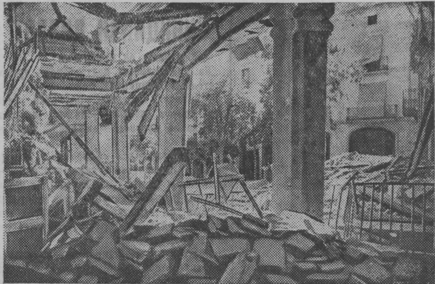
В республиканской Испании. НА СНИМКЕ: Один из городов Каталонии, разрушенный бомбардировкой итало-германских самолетов.