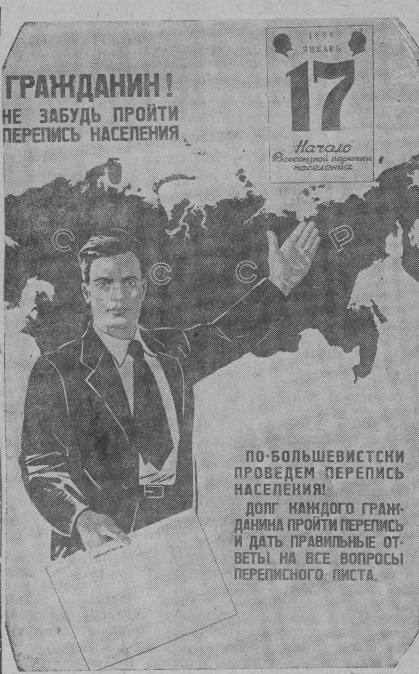
ПОДГОТОВКА К ВСЕСОЮЗНОЙ ПЕРЕПИСИ НАСЕЛЕНИЯ НА СНИМКЕ: плакат «Гражданин! Не забудь пройти перепись населения», выпущенный Институтом изобразительной статистики. (Дата съемки — сент. 1938 г.)