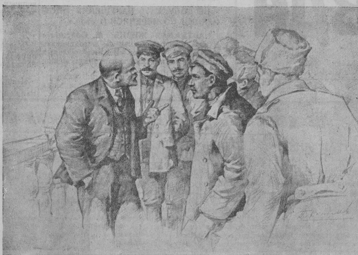
НА СНИМКЕ: В. И. Ленин, И. В. Сталин и Л. М. Каганович на Всероссийской конференции фронтных и тыловых военных организаций РСДРП(б). Июнь 1917 г. Рисунок художника П. Васильева. (Центральный музей В. И. Ленина)

Рамешковский райком партии установил в зале парткабинета микрофон. Это даст возможность коммунистам и беспартийной интеллигенции, проживающим в отдаленности от районного центра, прослушать лекции, устраиваемые в помощь изучающим историю ВКП(б). Лекции из парткабинета будут транслироваться по радио.