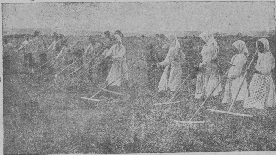
Колхознӱквлӓ шудым ыштӓт

ӱдӱм пӓшӱнӓ йажон ӓртӓрӓлтӱн гӱньӓт, цымырӓн шоктымӓшкӱ латна (спокойна) лиӓш ак кӓл. „Цыви-гӱвлӓм шӱжӱм шотлаг“ манмы тошты шайа улы. Тидӱ лачокӓш толӓш. Цилӓ ӱдӱмӱш-шӱндӱмӱшнӓм лӓвӓш лӱвӓкы цымырӓн шоктымӱкӱ ижӱ, качкаш, ыжалаш, фабри-заводвлӓшкӱ сырӱон йаралӓш лӱктӱн шоктымӱкӱ ижӱ, ка-