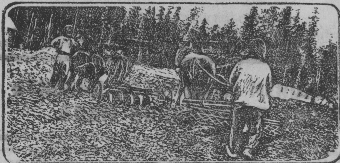
На полях Самаровского ОРСа леспромхоза