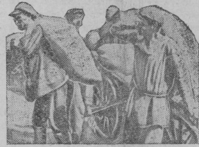
Liijat leivät — muakunalla