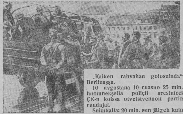
„Kaiken rahvahan golosuinda“ Berliinašša. 10 avgustana 10 cuasuo 25 min. huomneššella poličcii arestuicci ČK-n kolissa otvetvennoit partin ruadajat. Snimkalla: 20 min. zen jälgeh kult tuli poličcii.