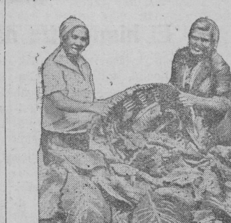
Воту tävveštä heinä rabieššannašta i silosan ladjuannašta — borcu sočializmahizešta žilvatan voimndtaš

Členy kolhoza «Mirovaja pobeda» Anciuarovskogo selsoveta (Lihoslavl'skogo raiona) v den' otдыхa organizovali krasnyj oboz s senom v 15 podvod. Plan senozagotovok kolhoz vpolnil na 40 proc.