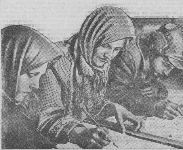
Карелы изучают письменность на родном языке