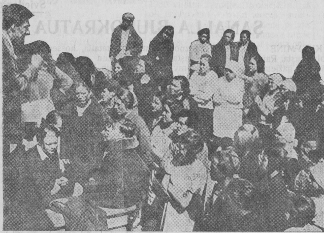
На снимке: Митинг трудящихся карел Сосновицкогo сельсовета, Лихославского района против антисоветского разгула финских фашистов