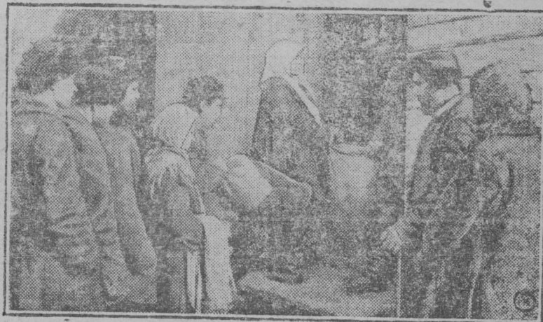
На Первомайском хуторе, Ханского юрта (Майкопского округа) комитет общества взаимопомощи приступил к снабжению семенной ссудой бедняков и батрачества, не вступивших пока в колхозы.

НА СНИМКЕ: Выдача семсуды беднякам и батракам.