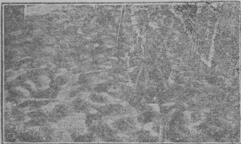
К весеннему севу сельским семеноводческим товариществом заготовлено до 640000 кгр. „шатилковского“ овса и вики. НА СНИМКЕ: Проверка качества зерна в помещении бывш. женского монастыря, который занят под хранилище семенного овса.