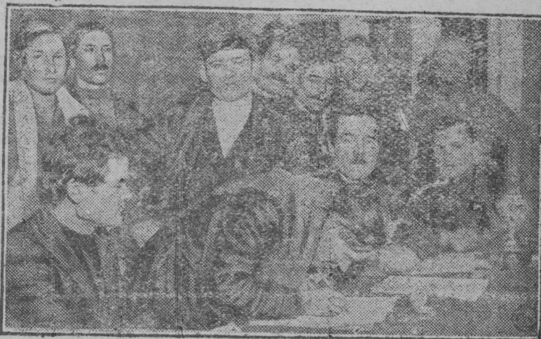
По инициативе череповецкой газеты „Коммунист“ Пусторадицкий с/совет вызвал на социалистическое соревнование по лучшему проведению весеннего ссва Починковский сельсовет (Череповецкий район). На снимке: Делегатка Пусторадицкого сельсовета подписывает договор.