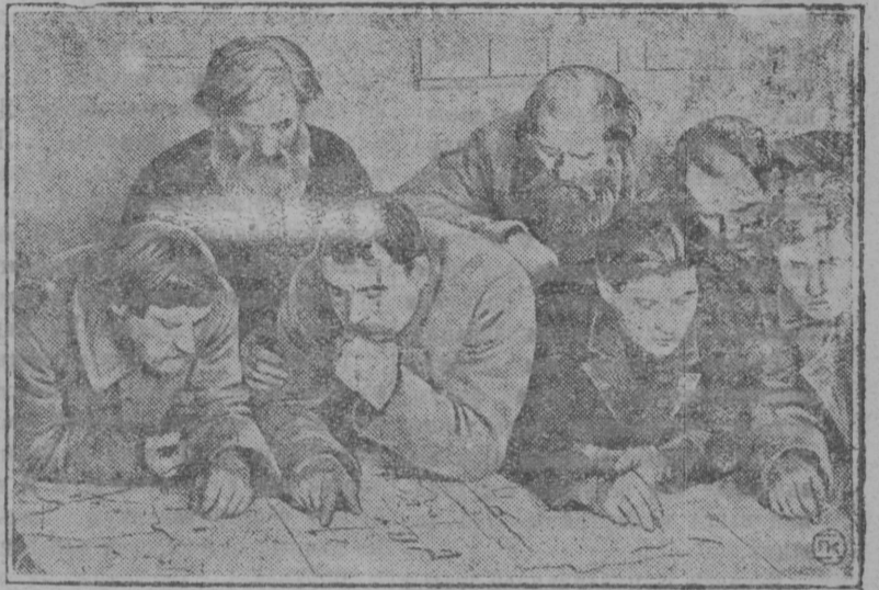
На снимке: Члены колхоза им. «Революция» Пермского окр. Сосновского района изучают по карте расположение земель колхоза с тем, чтобы составить наиболее целесообразный производственный план колхоза.

Нарком земледелия СССР Яковлев, обратился к академии с.х. наук с просьбой обсудить вопрос: возможно ли использовать пашню, которая находится под парами (ежегодно, примерно, четверть всей пашни). Академия признала оставление пашни под парами не выгодным. В большинстве районов СССР есть возможность ликвидировать пары и этим самым расширить посевную площадь до десяти миллионов гектар.