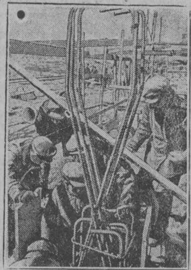
НА СНИМКЕ: установка шарнирных стержней в железобетонной раме.

400 рабочих созданы на Челябинском тракторостро. Наряду с таким подтверждением правильности линии партии жалко звучат отдельные голоса правых оппортунистов и троцкистов, объединившихся против взятой партией темпов.