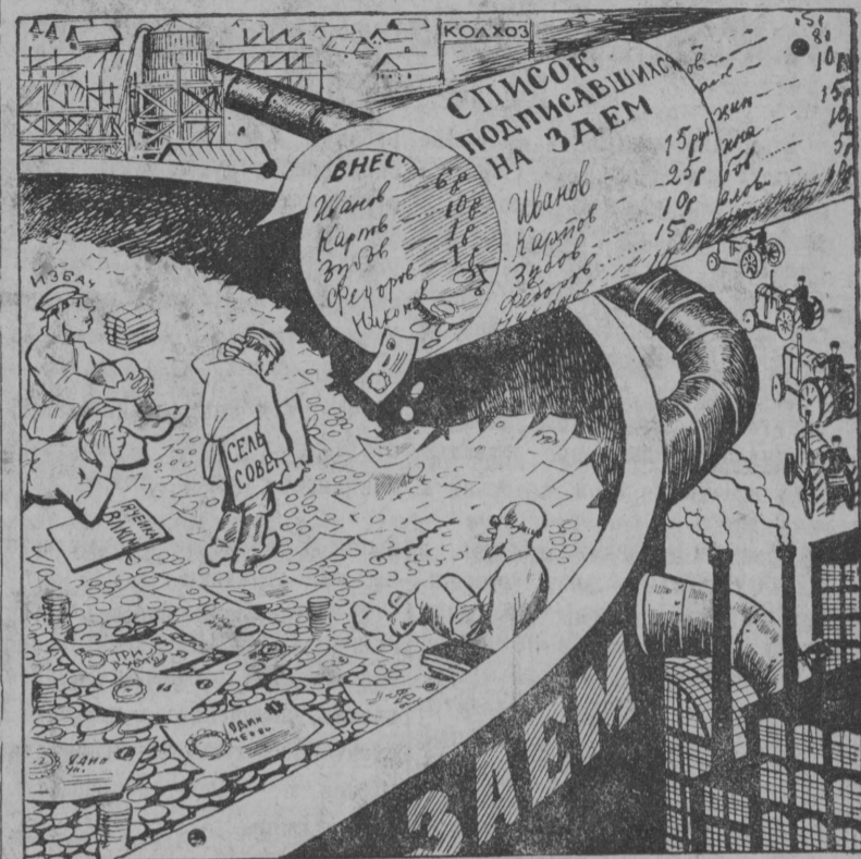
Задержка взносов по подписке на заем создает перебои в развитии социалистического строительства и тормозит снабжение сельского хозяйства машинами и удобрениями.

Усилим внимание к поступлению взносов по подписке на 3-й заем индустриализации.