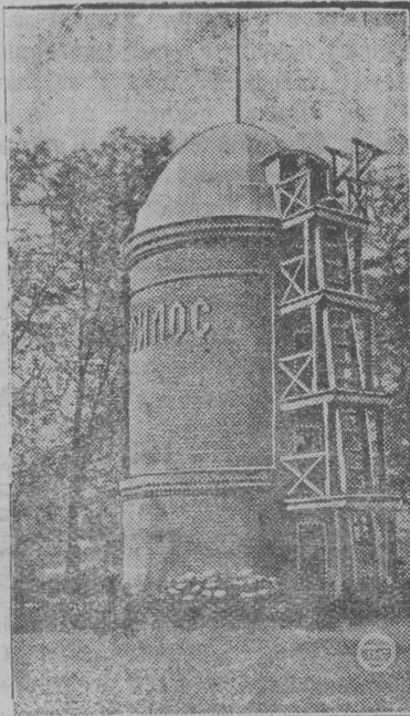
В каждый колхоз—силосную установку! НА СНИМКЕ: опытный силос Майкопского животноводческого союза.

Первым показателем смотра, по программе последнего, является выполнение плана весенней посевной кампании, так как рациональная организация труда предвещает успех производства. Но оказывается, что смотр труда, этот могучий рычаг, в большинстве колхозов не был использован в большевистский сев. Пока еще не кончена весенняя кампания по поздним культурам (технические, корнеклубнеплоды), нужно заострить внимание колхозников, агроперсонала и общественных организаций на вопросах смотра и дружной ударной работой немедленно исправить допущенные ошибки.