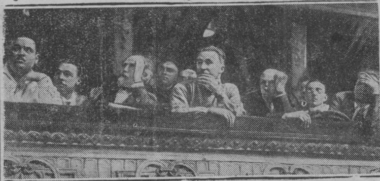
26-VI в Москве в здании Большого театра открылся XVI партсъезд.