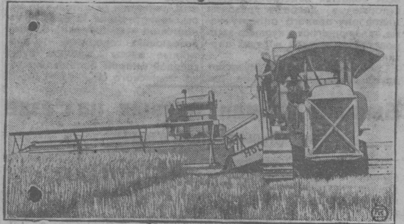
В зерносовхозах и колхозах Крыма началась уборка нового урожая. Ряд зерносовхозов производят уборку комбайнами. На снимке: Комбайн на работе в поле.

нономического кризиса и все еще не могут выбраться из трясины упадка?