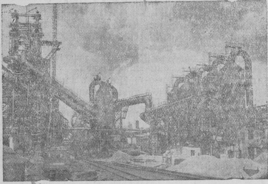
На снимке: На строительстве новой домны № 4 „Азов-стали“ (Мариуполь).