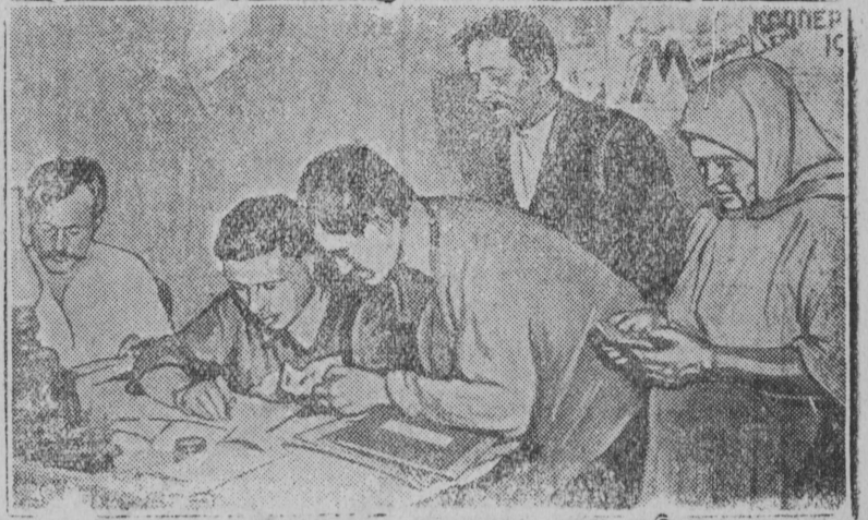
На снимке: Колхозники подписываются на заем.

Колхозники колхоза им. Розы Люксембург в с. Фрейдерово, Шевченковского района, подписались на заем „Пятилетка в 4 года“ на 1400 рублей.