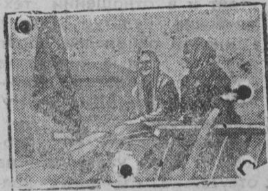
На снимке: Головная телега красного обоза по дороге на сыпной пункт.

Колхозницы и единоличницы Лебяжского сельсовета (Курск) организовали первый в этом году женский красный обоз. Обоз состоял из 50 подвод и привез на сыпной пункт 15 тонн хлеба.