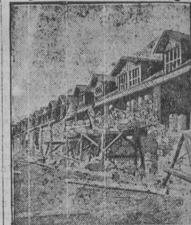
На снимке: Постройка коровников в животноводческом комбинате на ст. Рогань

Зујовскөј колхозлөн Јуев. р. вундыны ешө уна, зөрыс будбс-нө крөшөтчө, а Зујовчө керөмаө брагаез. суррез да ој і лун пірујтөны. Неважын вөлі релігіознөј пращнөк „Іван лун“ дак јыка і мужік кујм лун пірујтсө. Зујовчө, тырмас позорітны аснытө, дурдө пірујтны дө јештөтө чожажык страданытө.