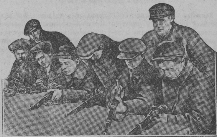
На снимке: члены ячейки Осоавиахима „Красного Путиловеца“ знакомятся с устройством винтовки.

Большую подготовительную работу к Всесоюзной декаде обороны провели рабочие Ленинградского завода „Красный Путиловец“. В Осоавиахим вовлекаются новые члены, открываются новые уголки и кабинеты Осоавиахима, усиливается военизация рабочих.