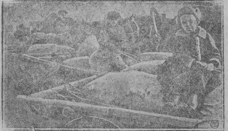
Потоком красных обозов с хлебом и овощами отвечают колхозники и единоличники вредителям и интервентам. На снимке: Красный обоз с картофелем, прибывший на Черновский селенный пункт.

Усилением нажима на кулачество, непримиримой борьбой с правыми и «леваками», широким развертыванием массовой работы среди бедняцко-середняцких масс единоличников и колхозников нужно добиться стопроцентного и срочного выполнения плана.