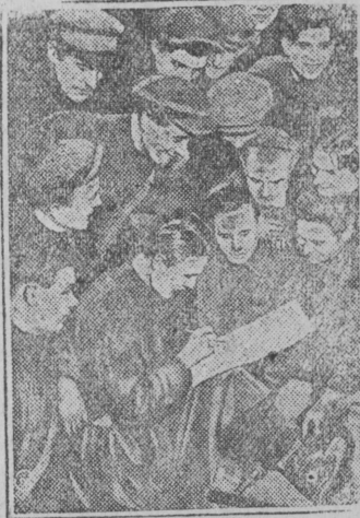
На снимке: Дополнительно подписываются на заем „Пятилетка в 4 года“.

Рабочие Московского завода „Арматура“ в ответ на вредительство „промпартии“ и угрозы интервенции начали дополнительно подписку на заем „Пятилетка в 4 года“. По одному механическому цеху завода „Арматура“ дополнительная подписка дала около 6.000 рублей.