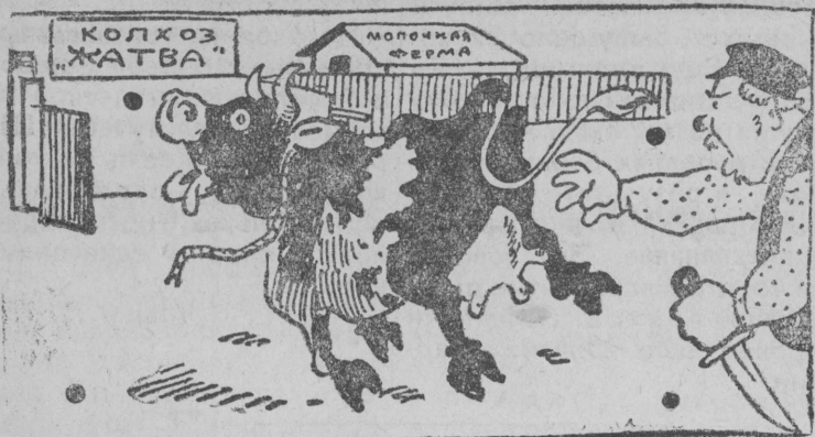
из под кулацкого ножа—в колхоз