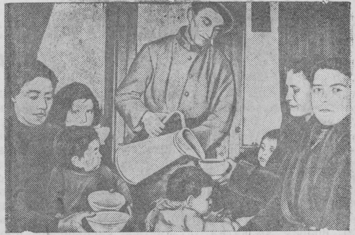
На снимке: женщины и дети получают свой скудный обед по дороге в концентрационный лагерь.

Больные женщины и дети—беженцы из Каталонии—по прибытии во Францию направляются в концентрационные лагеря.