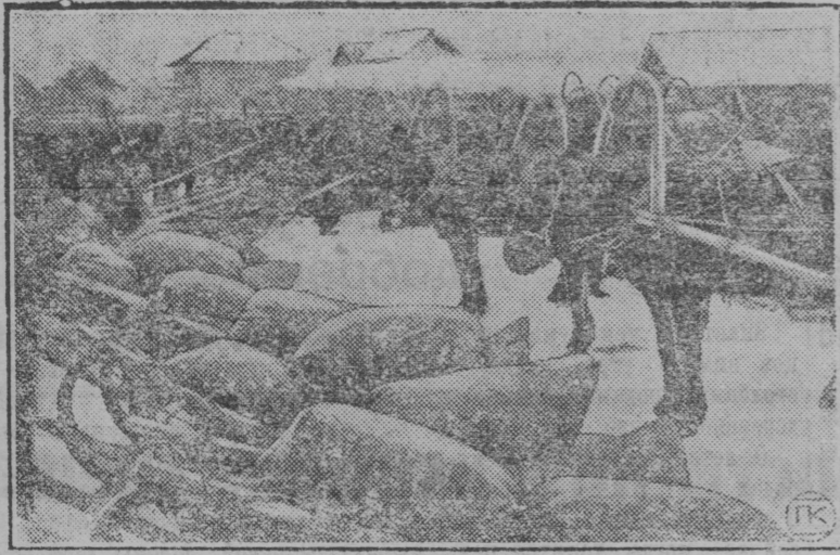
Крестьяне села Выдриха, Шемонихинского района, Семипалатинского округа доставили на ссыпной пункт хлеб красным обовом из десятков саяей. НА СНИМКЕ: обов у ссыпного пункта.