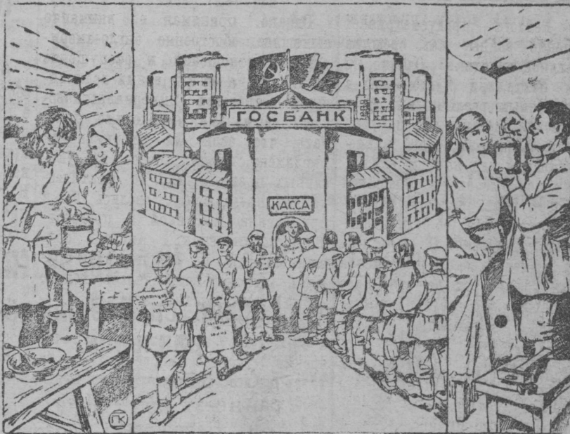
Несите свои деньги в сберкассу.