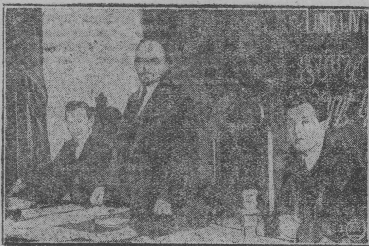
(6 марта 1919-1929 г.) НА СНИМКЕ: В. И. Ленин в президиуме 1-го Конгресса Коминтерна.

Десять лет назад было заложено основание Коммунистического Интернационала, революционной, боевой международной организации трудящихся. Ленин руководил учредительным международным с'ездом коммунистов. На с'езде присутствовало 34 делегата с решающим голосом и 16 с совещательным от 19 стран: Европы, Америки и Азии.