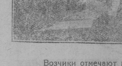
Возчики отмечают выполненные наряды.