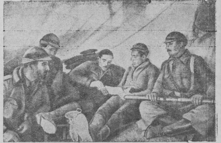
Бойцы республиканской армии, пользуясь временным затишьем на фронте, читают письма, полученные от близких.