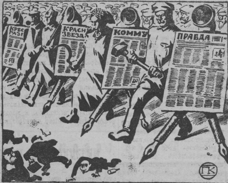
Советская печать мобилизует массы к борьбе и победе.