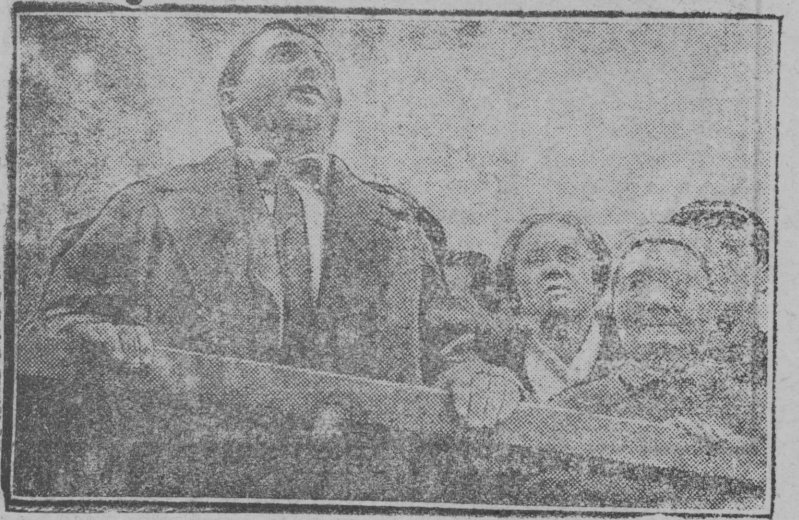
5-XI-29 г. в Москву прибыла германская рабочая делегация для участия в Октябрьских торжествах. Московский пролетариат устроил на Белорусском вокзале торжественную встречу германских товарищей.

НА СНИКЕ: представитель германской рабочей делегации приветствует Красную Москву.