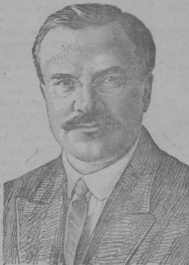
ССР Ушэм Калык Комисар-влак Совет вуйлатышэ В. М. МОЛОТОВ йолташ