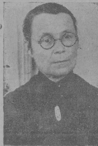
Йоча больницысэ пуй эмлышэ врач Барышэ-ва йолташ.

„Ташнур“ промколхоз, Звэнигэ район. 25 шэ февраль 1935 ий