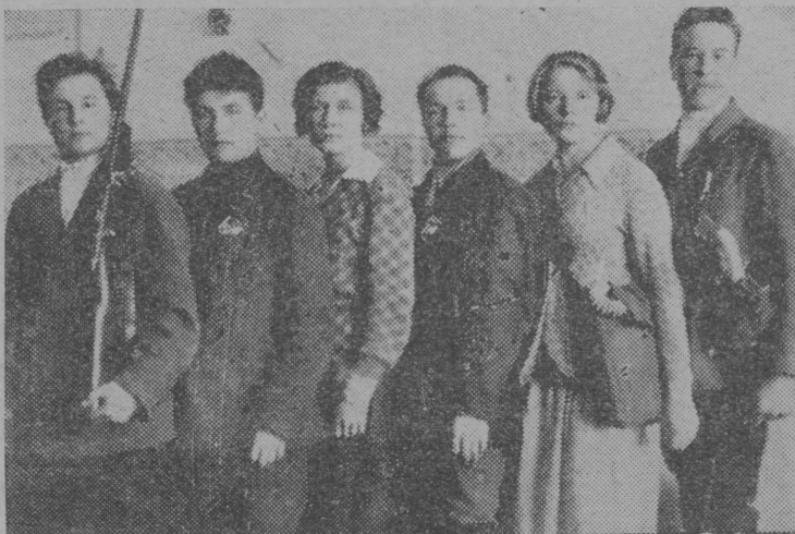
Марий Пэдагогик Институт студэнт-влак войэннэ заньатыштэ

— Чынак, тидэ Ивук, Арын йалсовет гыч толэш. Тудо Арын йалсоветыш 7-шэ совет погынымаш лүмэш культпоходышко ушнымо нэргэн ыштымэ погынымашкэ мийэн.