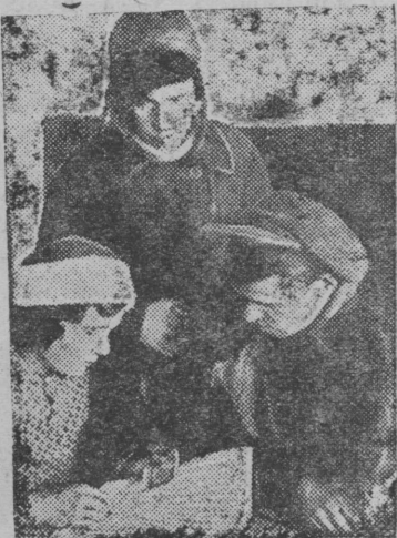
Колхозники проверяют свои облигации в сберкассе,