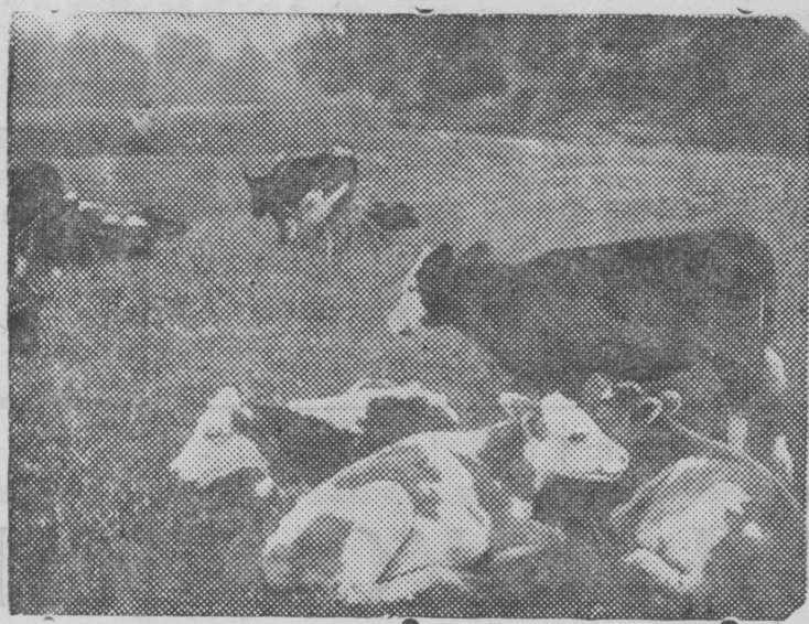
Колхозные телята на пастбище