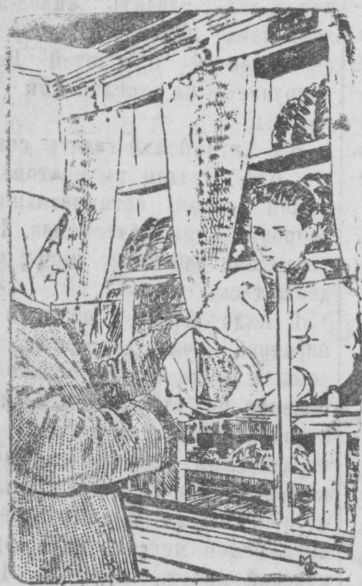
Колхозница покупает товары в сельпо.