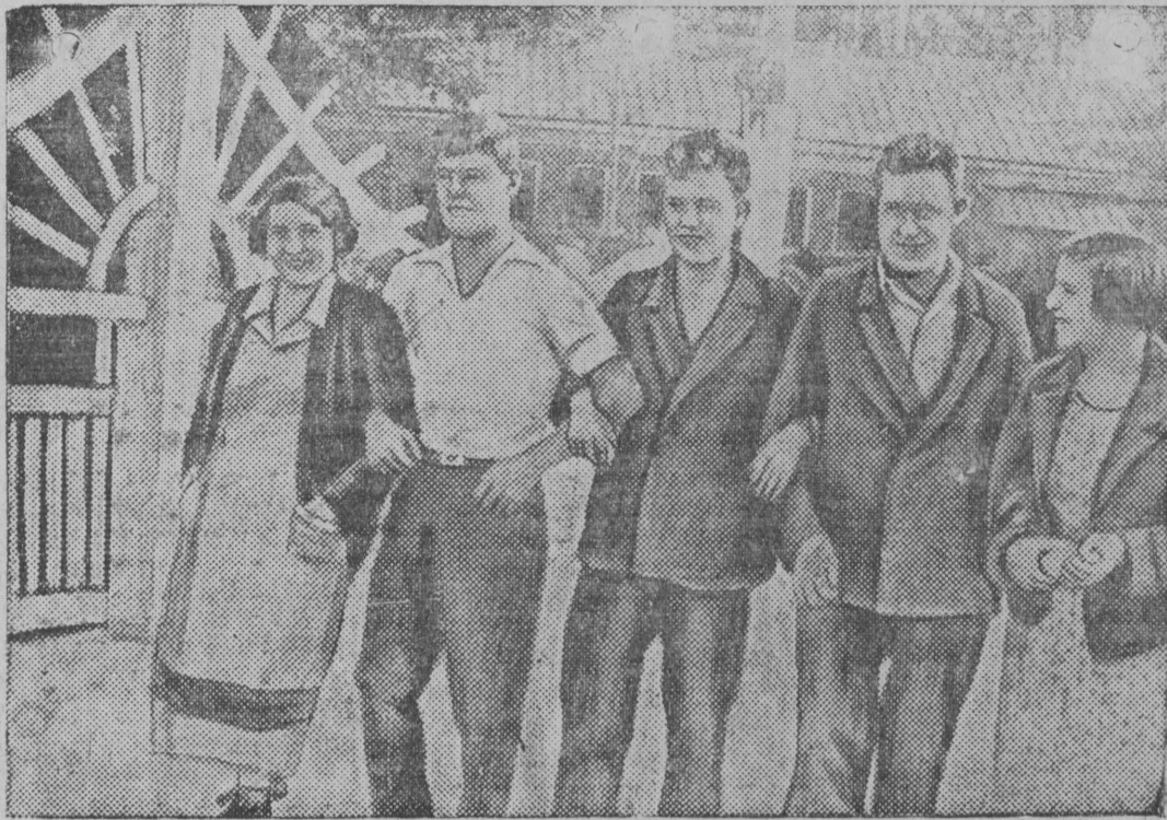
Солнечный день в Калинин. На прогулке.