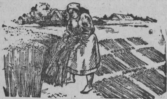
Двойное теребление льна

Непосредственно под лен можно и нужно вносить минеральные удобрения: суперфосфат, силвинит, сернокислый аммоний. Хорошо действует на лен и печная зола.