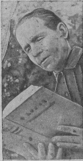
Колхозница за чтением книги