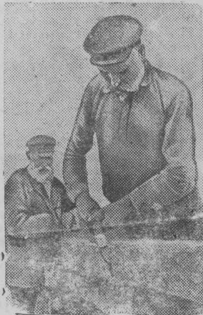
За постройкой ситного двора в колхозе

Замечательный подъем энергии и инициативы среди колхозников вашего района, большое желание работать по-стахановски, свидетельствует, что у вас в районе уже имеются значительные результаты и что ваш район может нынешний год провести отлично. Нужно обеспечить хорошее руководство колхозами, по большевистски подойти к организации соцсоревнования.