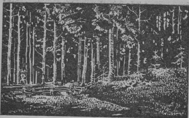
6-d сер. Козја-парма.

Шоч-вөрын-нын став - пуыс өтi - арлыда. Унжыклаас воөм-пујас - пөвсын ембө том- -пујас.