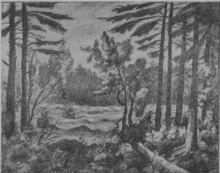
2-d сөр. Вөсавтөм-вөр.

Вөрүн биһн колө вөдйтчыны жона-вөдчы- сөмөн. Кос-дырји бипурјас (костры) оз ков өставны. Куритчыелы изтөгсө да чигарка- помсө кувөдтөг оз ков шыбытны. Кос-дырји вөсөг кеңыс ыжыд-би вермас лоны.