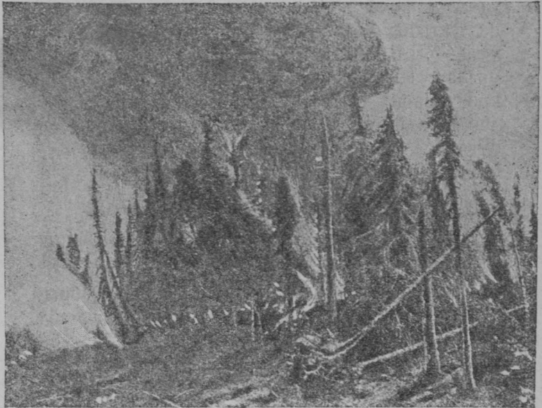
1-ңа сер. Вөр сотчө.

зыдыс оз овлы-да, муыс һаһсө куждтөг ва- жө-да. Кыңи ескө ми, комјас, вөртөгид кутам овны?