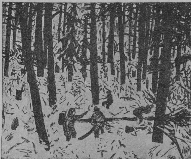
4-d сеп. Кер-пөрөдөм.

петкөдлө кымын во јешцө најө вермасны сулавны. Артмас: кымын-пу позө керавны быд-во. Сы-серти сесса і јуклөны вөрсө, бөр-јөны да пасјалөны кытысаң заводитны ке-